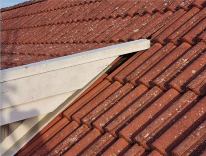
Bilden visar otäthet vid takutsprång.