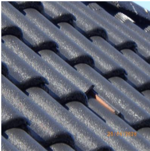
Trasig takpanna (entrésidan högt upp).