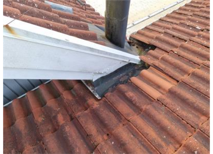
Bilden visar anslutning mellan bostadshus/garaget.