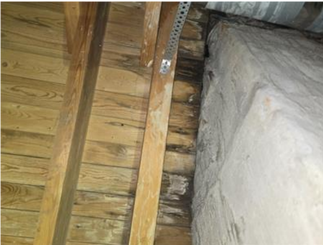
Fuktfläckar kring murstocken. Torr vid besöket, om fuktfläckar ökar växer måste en vidare undersökning utföras.