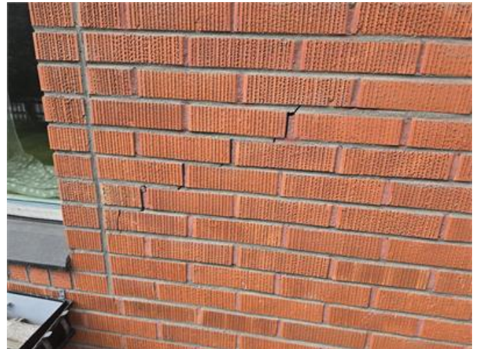
Exempel spricka i fasaden.