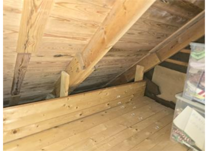
Överblick del av vinden.