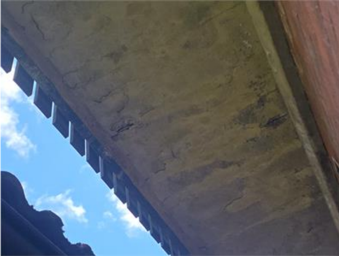
Bilden visar undersidan av balkongen.