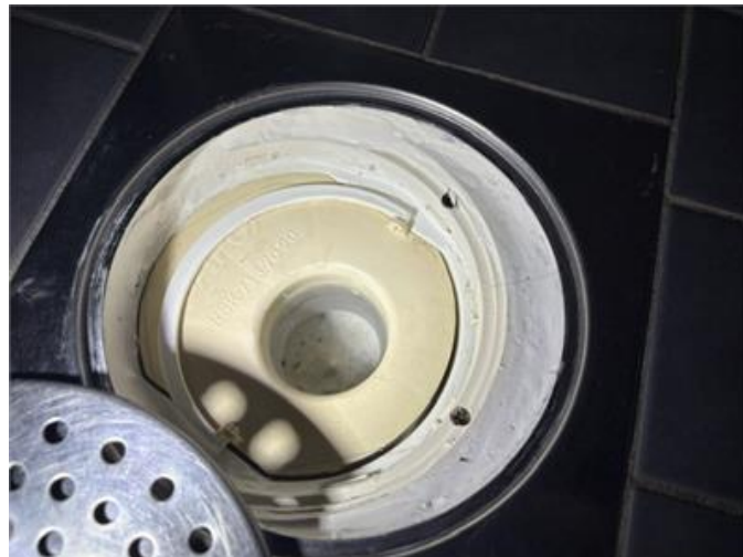
Bilden visar golvbrunn där tätmassa/mjukfog är applicerat mellan klinkerram och golvbrunn.