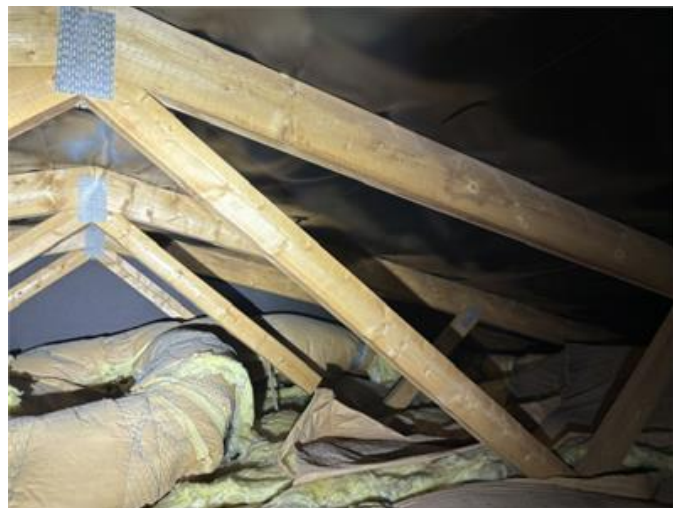
Bilden visar vy av vind (garagebyggnad).