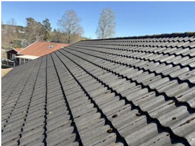
Bilden visar vy av tak.