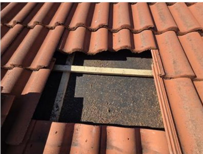
Tak: Stickprovskontroll under pannor, frömjöl noteras.