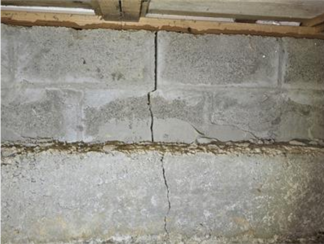
Krypgrund: Sättningspricka noteras i grundmur.