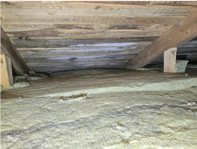
Nockvind: Mikrobiell påväxt noteras på underlagstak.