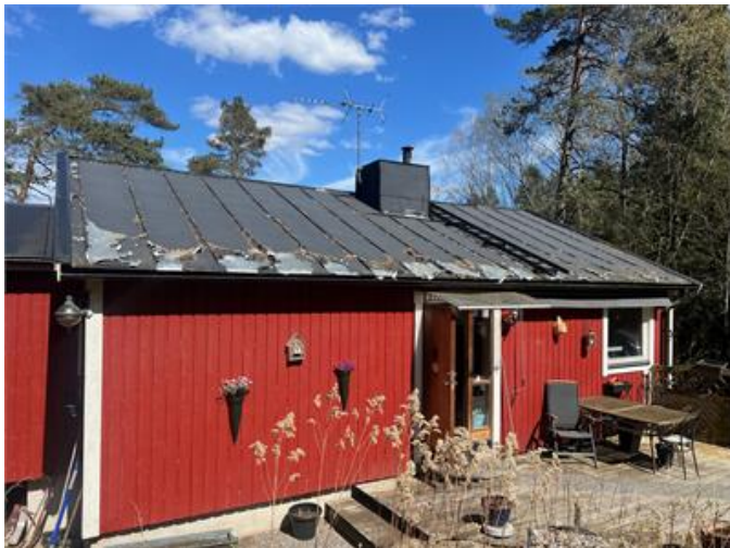
Taktäckningen är av äldre datum.