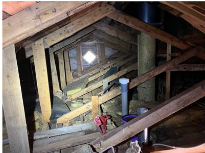
Del av vindsutrymmet.