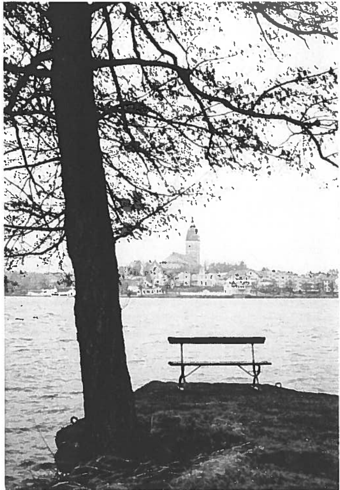
Utsikt från strandpromenaden i Sundby Park

Strängnäs är fortfarande en idyll, men också en modern industriort med ett flertal branscher som elektronik, data, livsmedel, kemi och bioteknik samt försvaret.