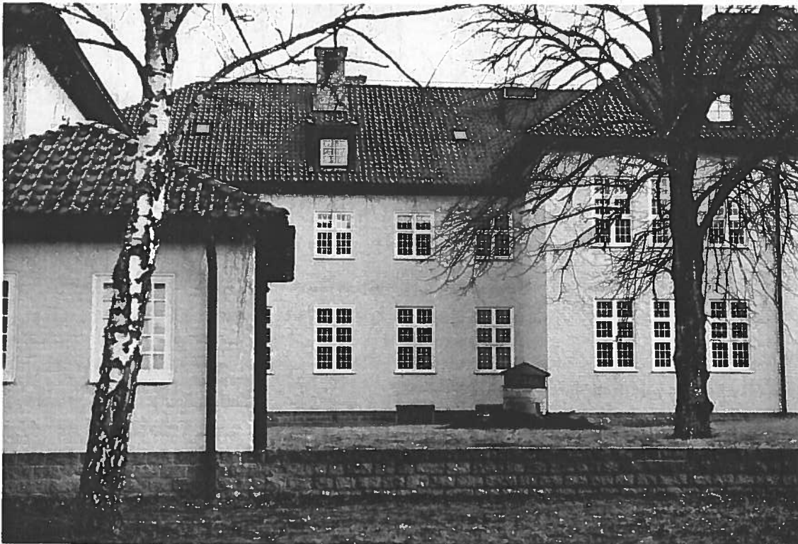
"Herrgårdsliknande" miljö i Sundby Park

Intill Sundby Park planeras ett större bostadsområde samt ett stadsdelscentrum med skola och butiker.