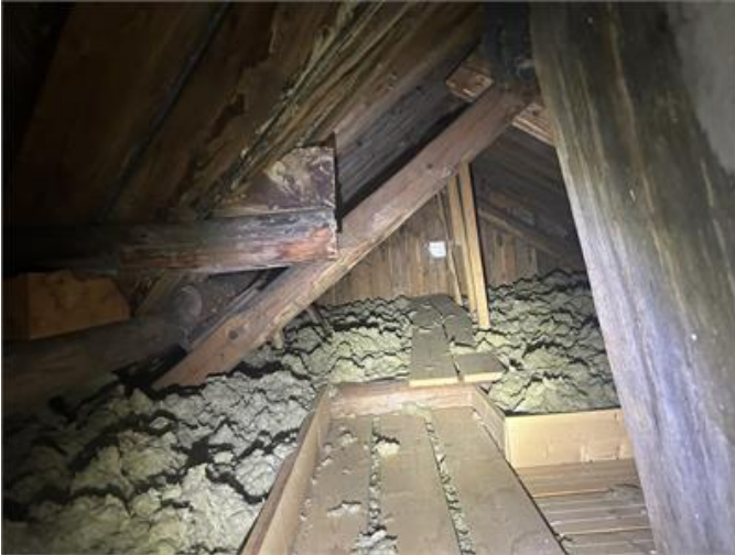
Nockvind: Översiktsbild 1.