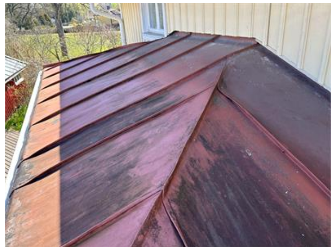
Tak ovan klädhall: Översiktsbild.