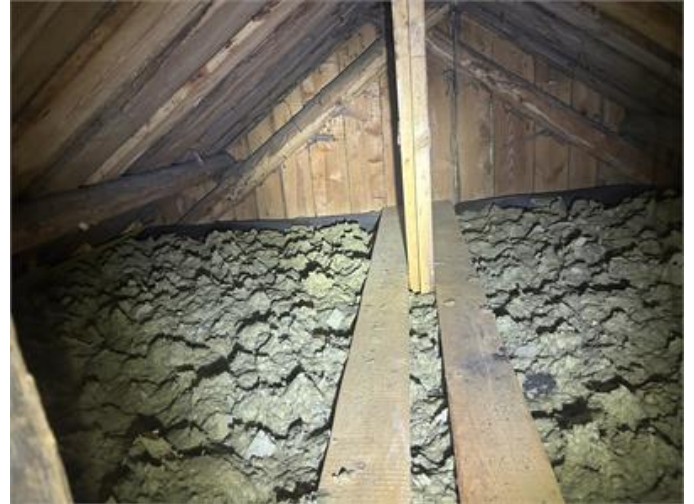
Nockvind: Översiktsbild 2.