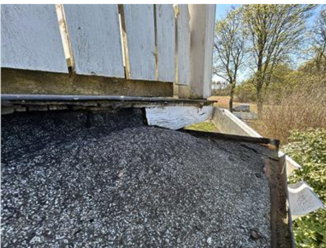
Balkongkant: Ytsikt i form av papp på balkongkant är uttorkat och i behov av utbyte.