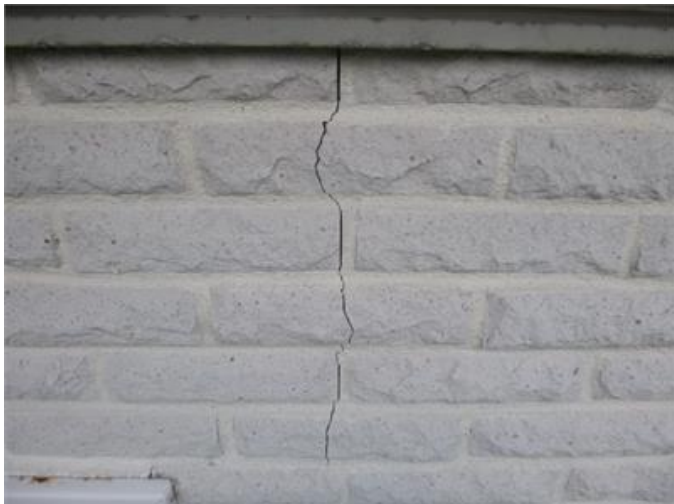
Bilden visar exempel på spricka i fasaden.