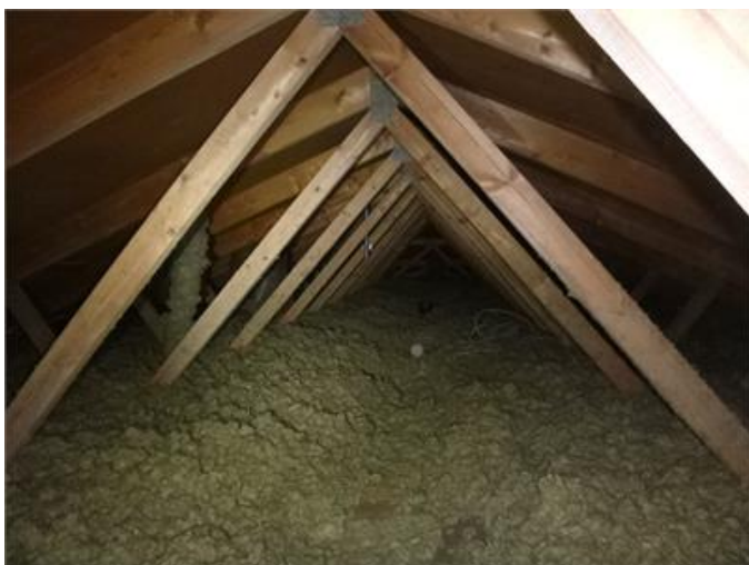
Bilden visar vy av vind.