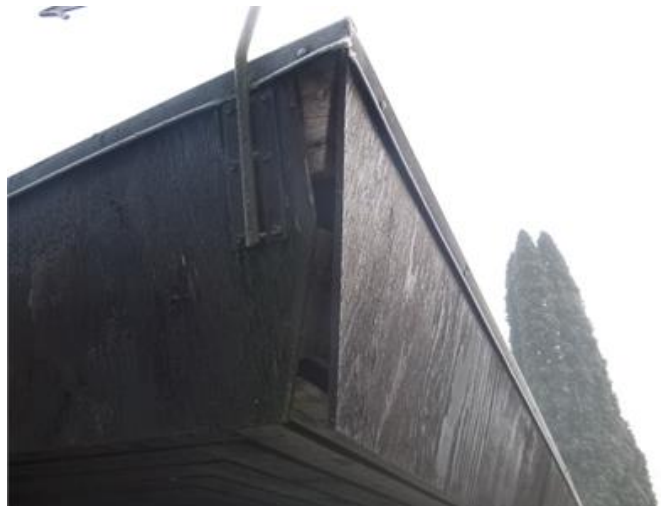
Bilden visar otätheter i taksargen.