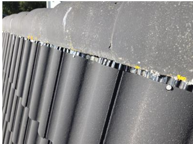
Synliga infästningar på översta pannraden.