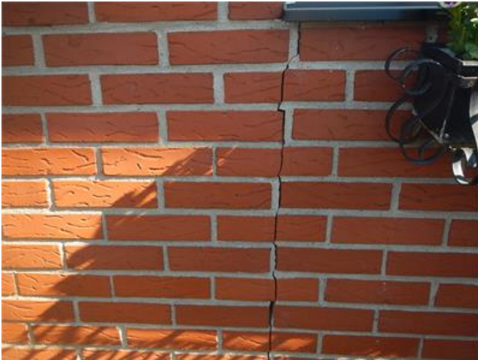
Spricka i tegelfasaden.