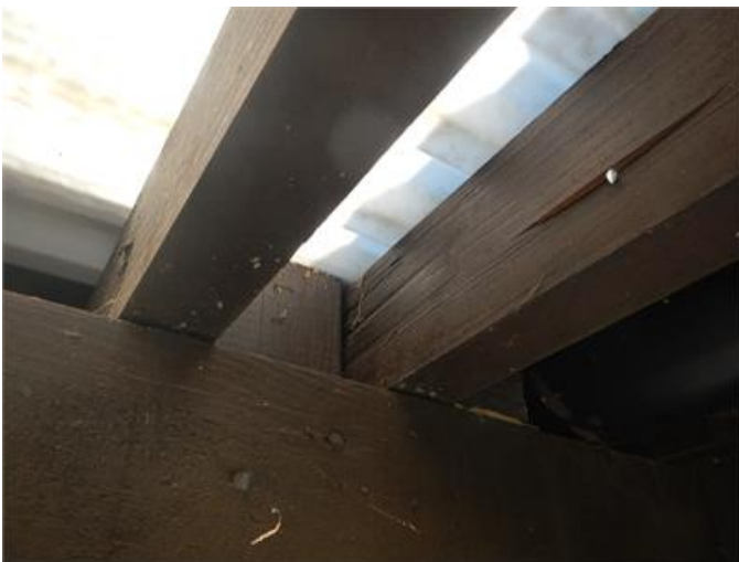
Rötskador i takstol på carporten.