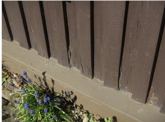
Rötskador i fasadpanel på garaget.