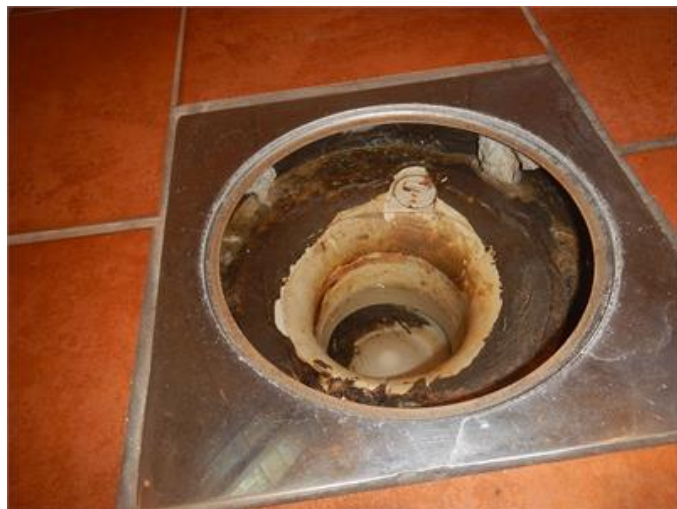
Äldre golvbrunn i duschen på entréplan.