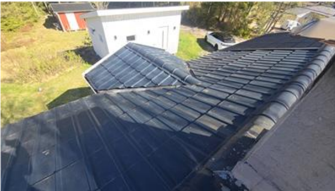
Översiktsbild, del av yttertak.