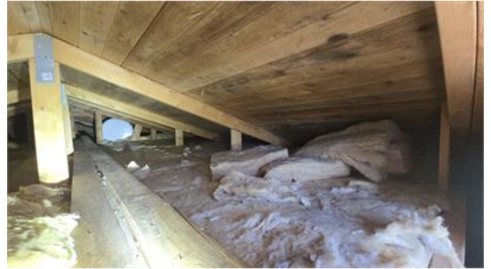
Översiktsbild, del av vindsutrymme.