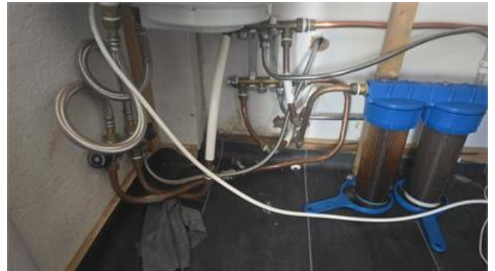
Del av utrymme med vatteninstallationer.