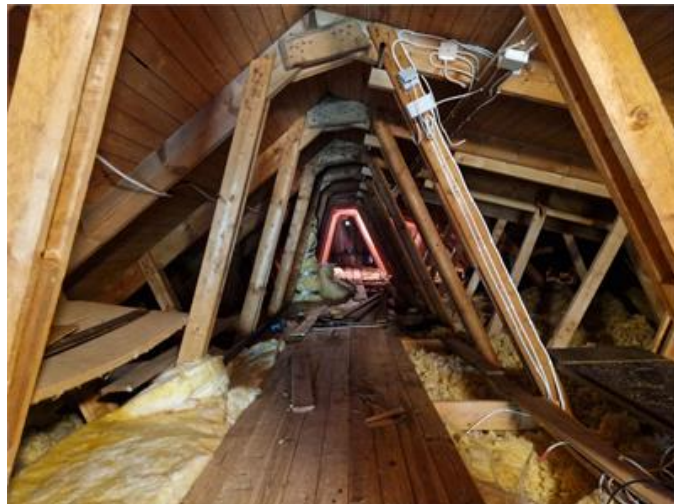
Vy på underlagstak