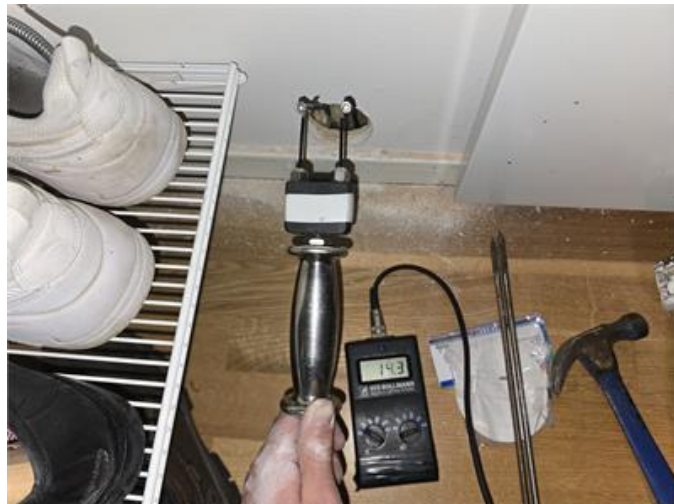
Fuktmätning i klädkammare.