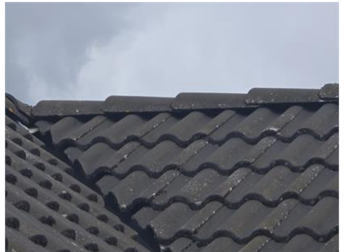
Exempel på takpannor i rännedal som täcker bristfälligt.