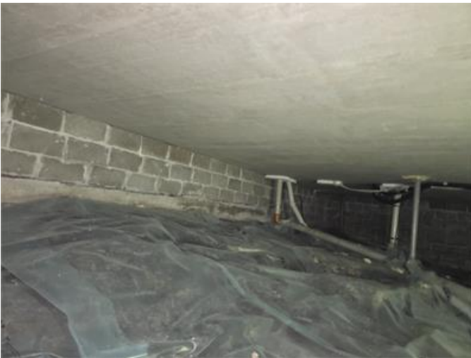
Överblick del av krypgrunden.