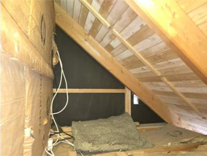
Exempel från en sidovind och mikrobiell påväxt. Bör kontrolleras regelbundet.