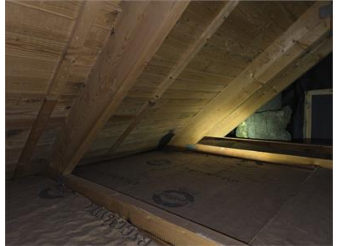
Exempel frånnockvind med missfärgning/mikrobiell påväxt. Bör kontrolleras regelbundet.