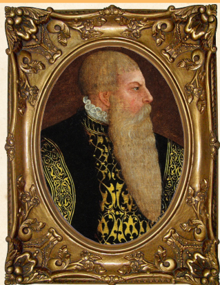
Magnus av Sachsen-Lauenburg