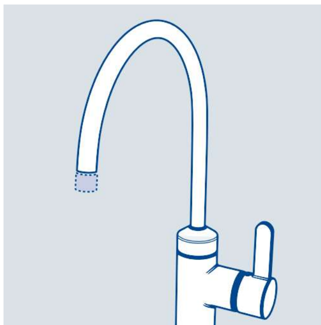
Ett sätt att minska vattenförbrukningen är att byta ut det gamla munstycket till ett vattenbesparande munstycke.