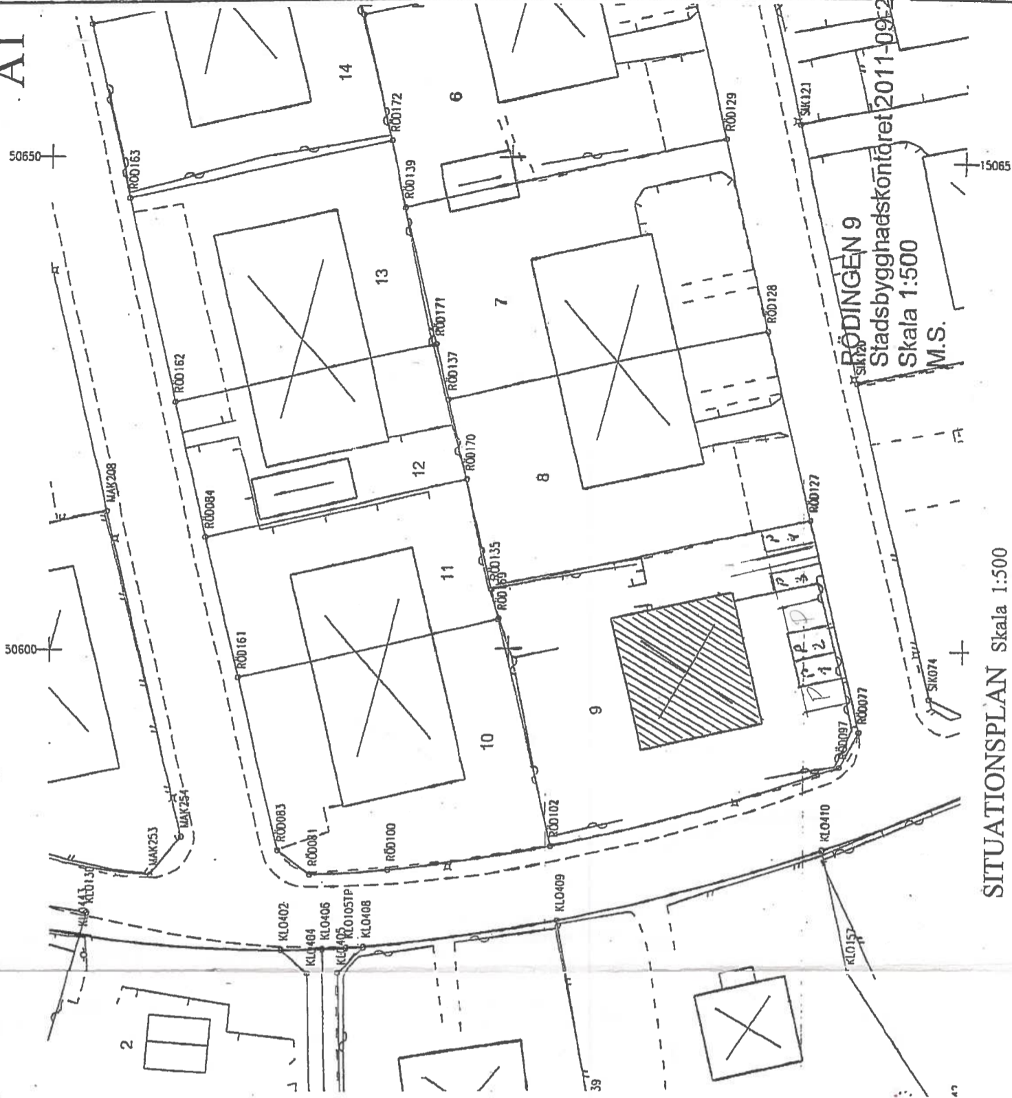
SITUATIONSPLAN Skala 1:500