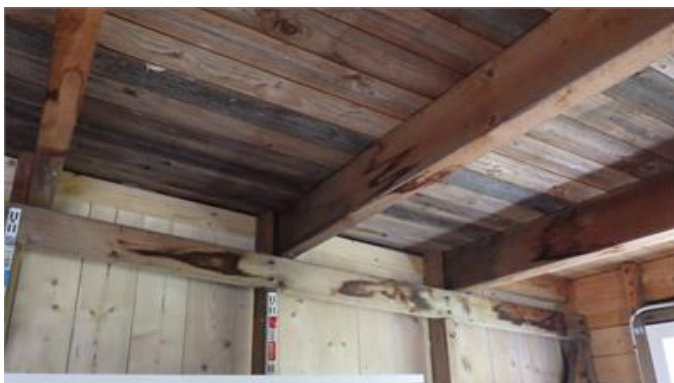
Fuktfäckar på insida yttertaket i garagebyggnaden