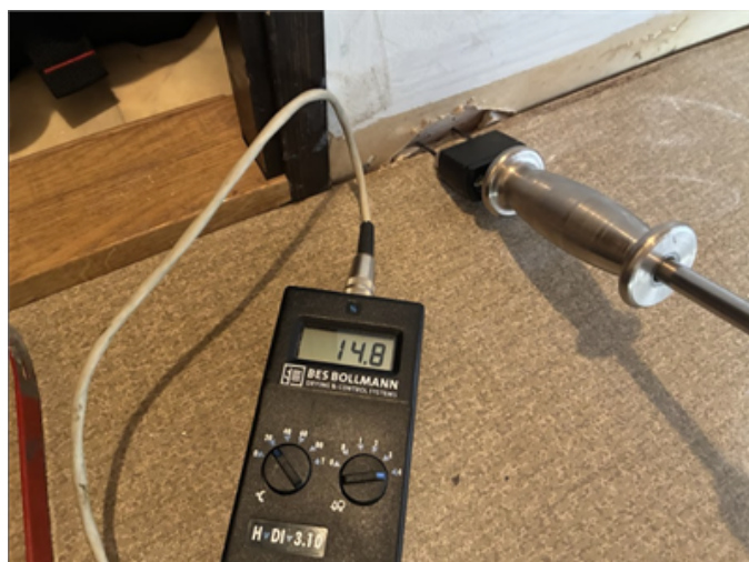
Bilden visar fuktkvotsmätning i klädkammare, gränsvärde är 17%FK.