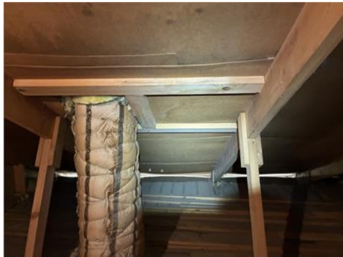
Nockvind: Mindre missfärgningar finns på träfiberskivor på några ställen.