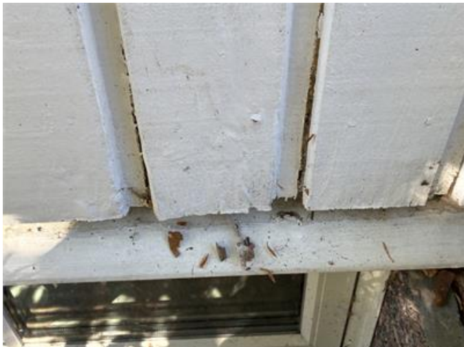
Fasad: Bilden visar rötskadad fasadpanel lokalt på byggnadens framsida under fönster, några brädor har behov av byte.