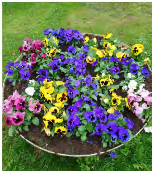
Bilder från vår "blomstergata"