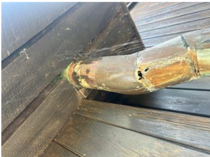
Exempel på otätheter i takavvattning.