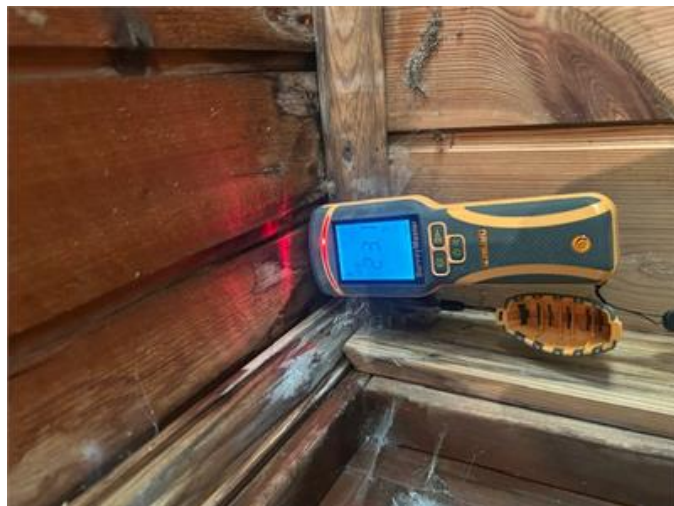
Fuktindikation i källarens tak/väggvinkel.