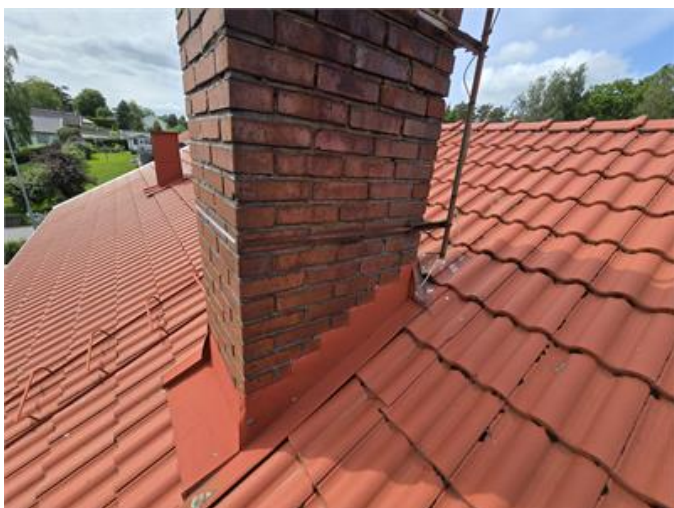
Tak: Fog på murstock bristfällig, plåtar täcker ej erforderligt över pannor.