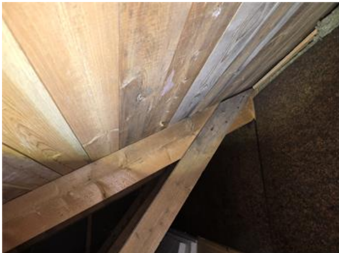
Sidovind: Mikrobiell påväxt förekommer på underlagstak.