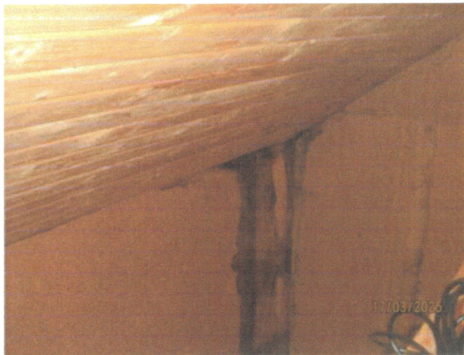
Fuktfläckar förekommer på underlagstak, vilket bör kontrolleras för att fastställa om åtgärdsbehov föreligger. Fläckarna uttorkade vid besiktningstillfället.