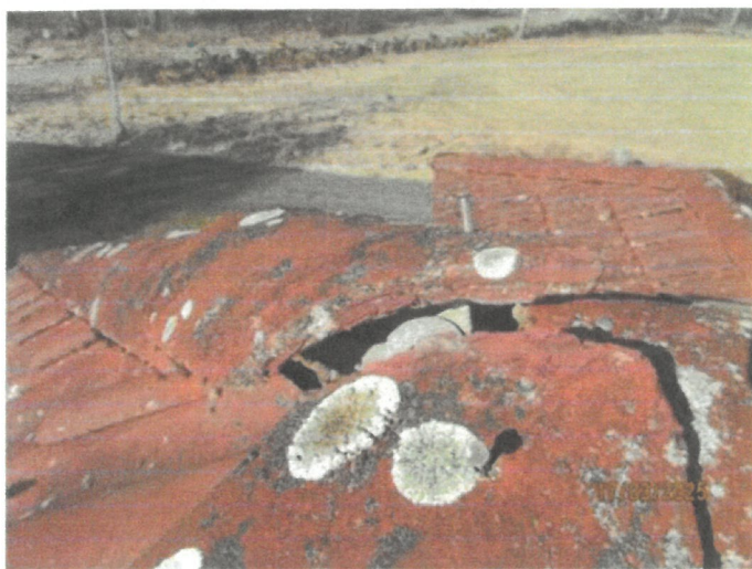
Briser/otätheter förekommer på taket vilket bör kontrolleras och åtgärdas i erforderlig omfattning.