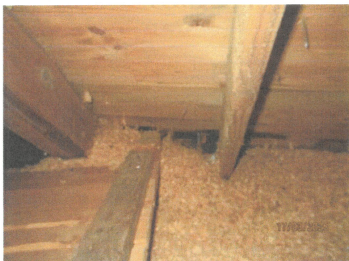
Fuktfläckar förekommer på underlagstak, vilket bör kontrolleras för att fastställa om åtgärdsbehov föreligger. Fläckarna uttorkade vid besiktningstillfället.