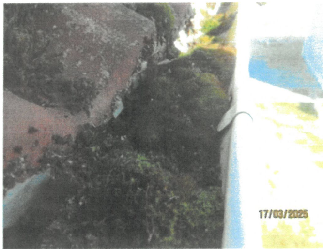
Skräp i hängrännor.