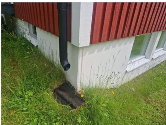
Takavvattning bör ledas bort från hus/grund.