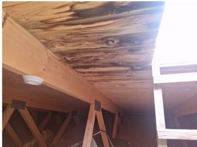
Fläck vid vindsluckan.