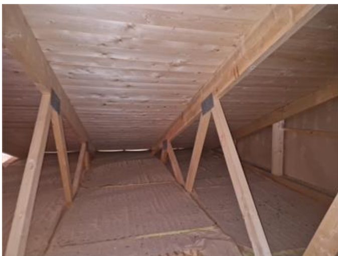
Vind är i övrigt fin.