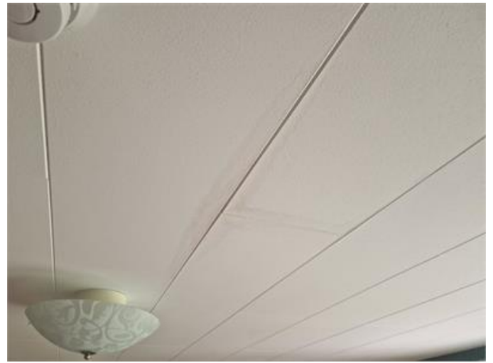
Fuktfläckar noteras i sovrum.