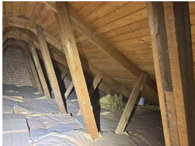
Översiktsbild av nockvind.