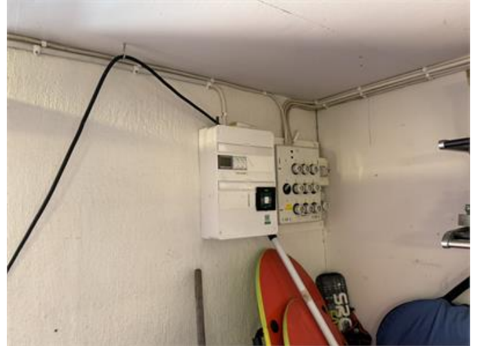
Skarvkabel har anslutits till elcentral i garage.