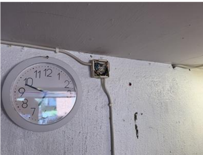
Täcklock saknas på kopplingsdosa i garage.