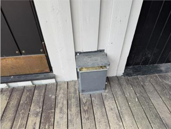
Plåtlåda utanför entré har gått isär.