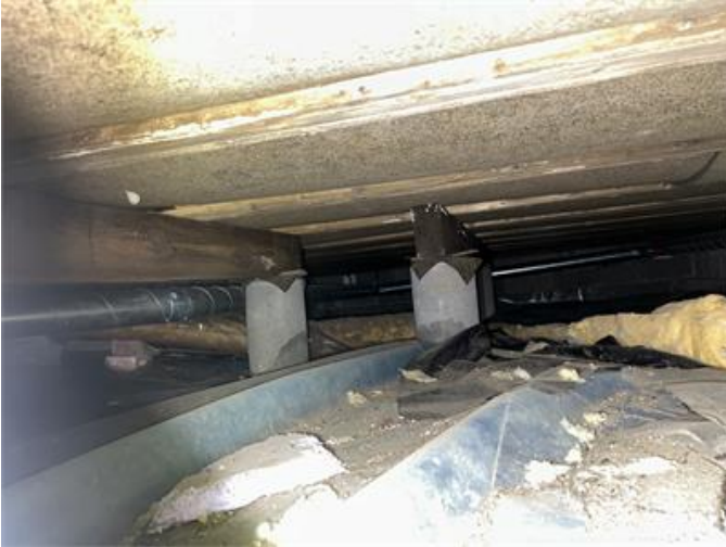
Krypgrund: Översiktsbild 1.