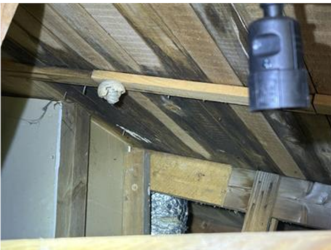
Nockvind: Nockvind: Fuktanvisningar förekommer på flera ställen