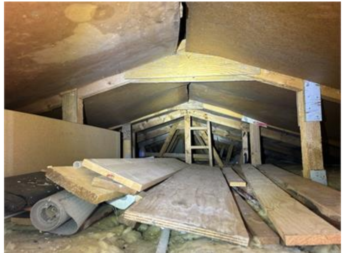
Nockvind: Översiktsbild .