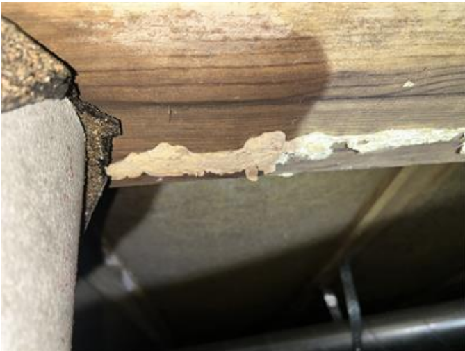
Krypgrund: Svamp och rötskador förekommer på flera ställen bla. Syllar, Bärlinor och Golvbjälkar.