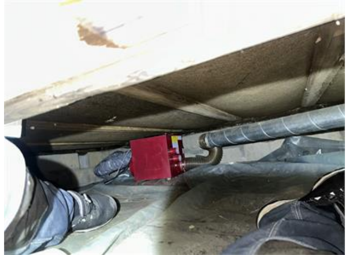
Krypgrund: Översiktsbild 2.