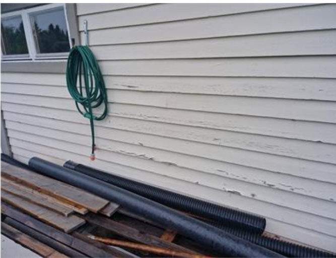
Fasad på garage har underhållsbehov.