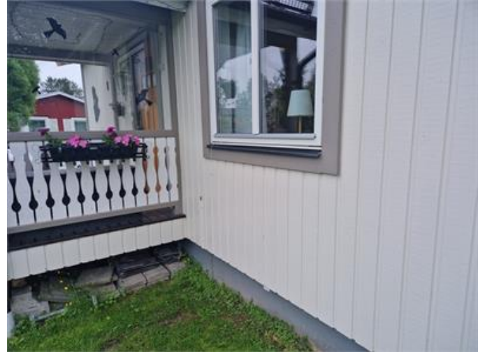
Fasad och fönster.