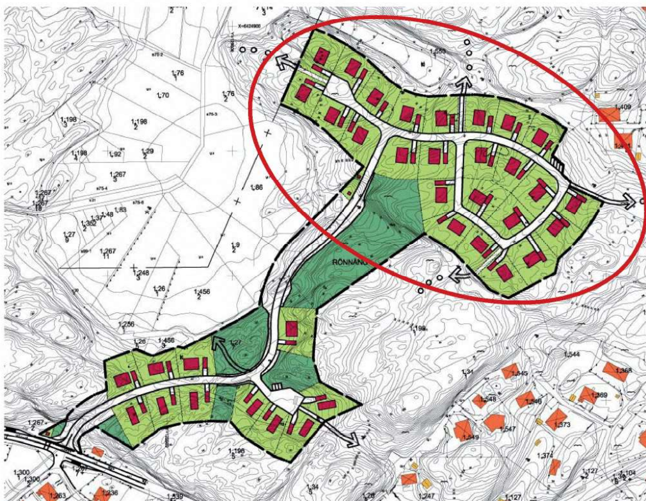
Illustration av ett utbyggnadsförslag bland flera. Aktuellt planområde inringat i rött.

Planförslaget är anpassat till områdets kuperade terräng. Nivåskillnaderna har inarbetats i planförslagets gatu- och bebyggelsestruktur. Ett trafikförslag har tagits fram som redovisar att det är möjligt med gatulutningar om maximalt 10 %.