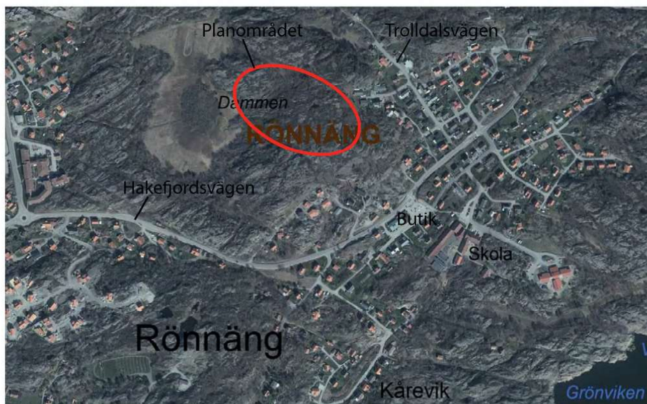
Befintliga vägar och bebyggelse i anslutning till planområdet.

Allmänna vatten- och spillvattenledningar finns utbyggda i anslutning till planområdet; i angränsande villaområden vid Hakefjordsvägen och Hästskovägen/Trolldalsvägen. I söder, vid Hakefjordsvägen, finns en kommunal huvudvattenledning med ledningsdimension 150 mm. I anslutning till Hakefjordsvägen finns även en spillvattenledning med dimensionen BTG 225 mm.