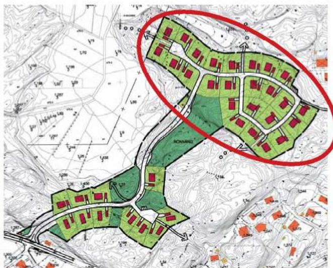
Illustration över gällande plan för området som vann laga kraft 2014, med aktuellt planområde markerat.

I tätortsstudien preciseras huvuddelen av det aktuella planområdet som utvecklingsområde för bostäder med närhet till infrastruktur, skola och service. Ett centralt beläget höjdparti inom planområdet redovisas som viktigt för landskapsbilden då det utgör ett utsiktsläge.