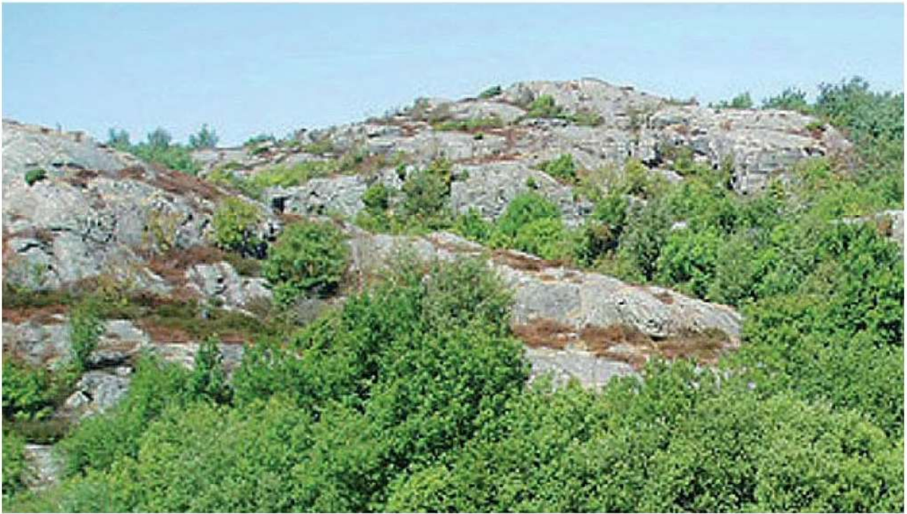
Karaktäristisk vy över landskapet i omgivningen.

Länsstyrelsen gavs inom föregående planarbete tillfälle att yttra sig över behovsbedömningen och kommunens förslag till ställningstagande. Länsstyrelsen har 2011-09-21 skriftligen meddelat att Länsstyrelsen delar kommunens uppfattning. Ett genomförande av förslaget kan dock innebära viss miljöpåverkan med avseende på att fornlämningar finns inom området, påverkan på landskapsbild, ny tillfartsväg samt geotekniska förutsättningar. Detta måste studeras och konsekvenserna måste beskrivas i samband med fortsatt planarbete.