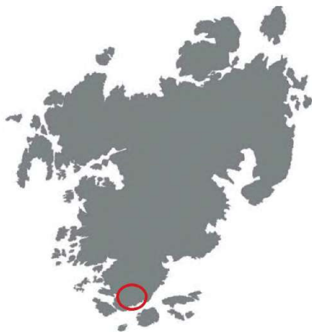
Planområdets placering på Tjörn.

Antikvariskt utlåtande, Tjörns kommun, 2012-10-19