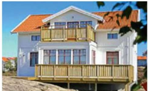
Exempel på utformning av bostäder i bergig terräng, målade i ljus respektiv dov kulör