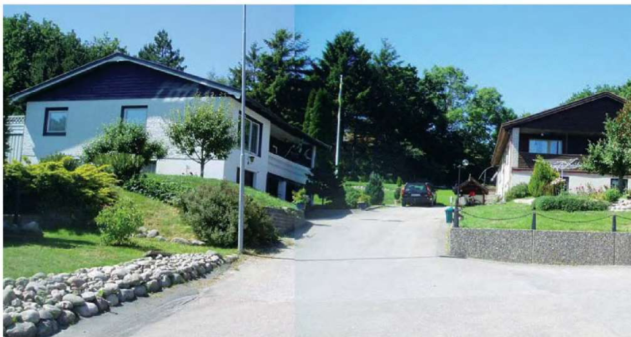
Befintlig bebyggelse i närområdet.

Äldre trähus med trä- eller eternitfasad i vitt dominerar, men även nyare villor förekommer. Flertalet byggnader i närområdet bedöms vara från 1970 till 1990-talet.