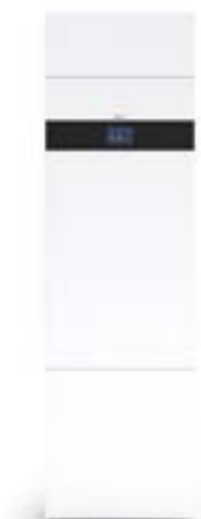
IVT Vent 402 frånluftsvärmepump.

uppleva en kylande effekt i direkt anslutning till glasytorna. Golvvärmens rör är samlade i ett fördelarskåp. Här finns ventiler som öppnar och stänger tillförseln av golvvärme. När du vill sänka temperaturen i rummet trycker du på pilarna på termostaten som sitter på väggen. Termostaten kan se ut på flera olika sätt och nedan ser du en principbild. Tänk på att det tar flera timmar innan du märker skillnad på temperatur i rummet eftersom värmen delvis finns lagrad i betongplattan. Du kan inte få mer värme i det enskilda rummet än vad inställningen på värmepannan är angiven till.