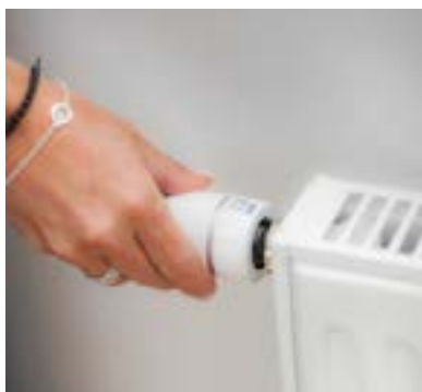
Radiatörer på plan 2.