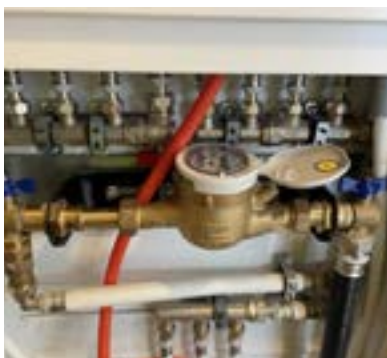
Vattenfördelarskåp med vattenmätare. Placerat i vägg under Innertrappan.