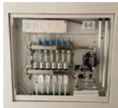
Fördelare av golvvärme. Skåp placerat i vägg under innertrappa.