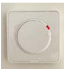
Termostat golvvärme plan 1.