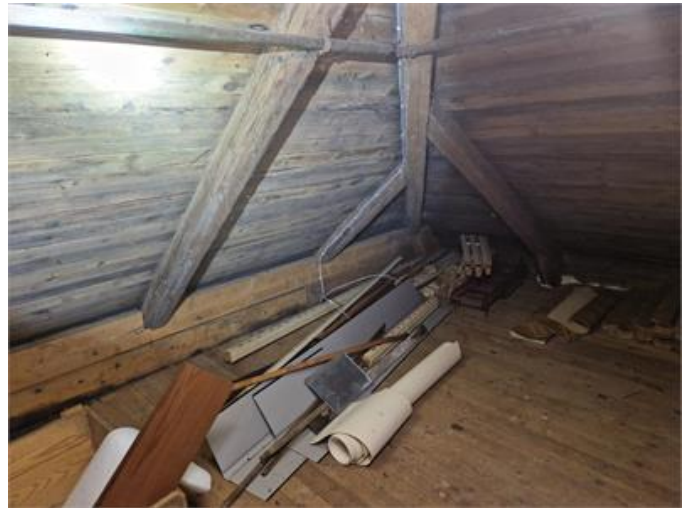
Mikrobiell påväxt på vinden