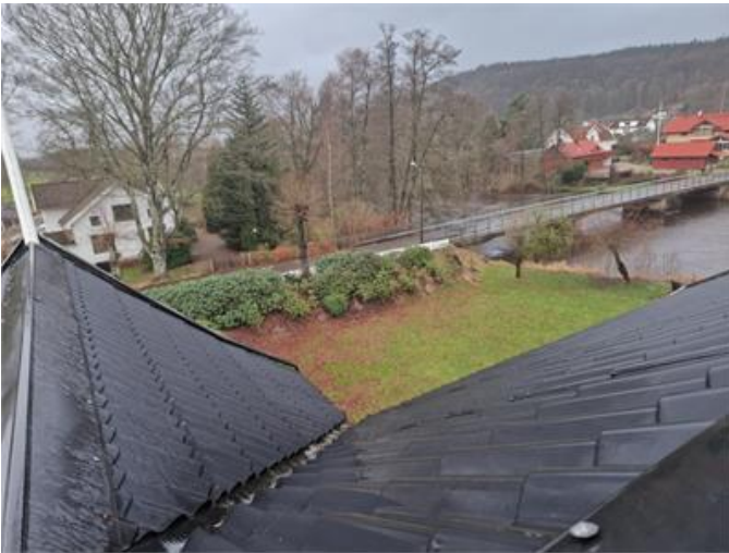
Vy på yttertak