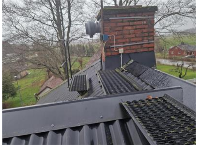
Vy på yttertak