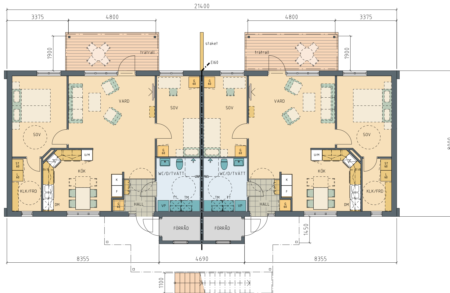
PLAN BOTTENVÅNING 2 LGH - å 3 RoK 76,5 M 2