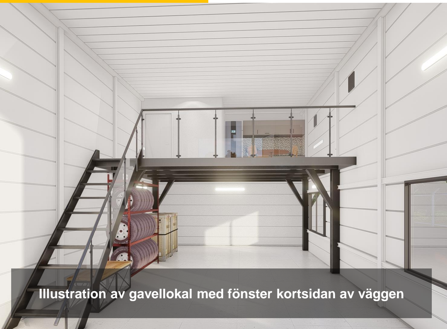
Illustration av gavellokal med fönster kortsidan av väggen

M2 Sverige AB Boulevarden 22 183 74 Täby