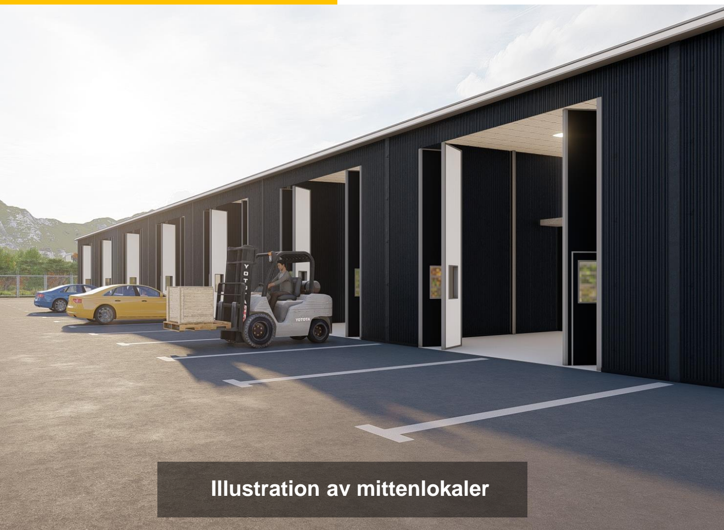
Illustration av mittenlokaler

M2 Sverige AB Boulevarden 22 183 74 Täby