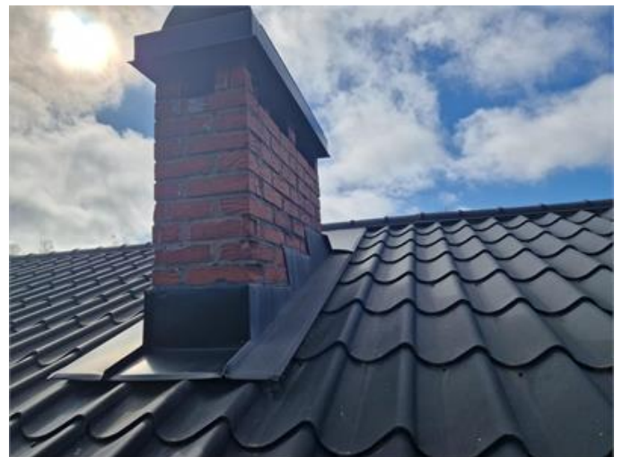
Vy på taket