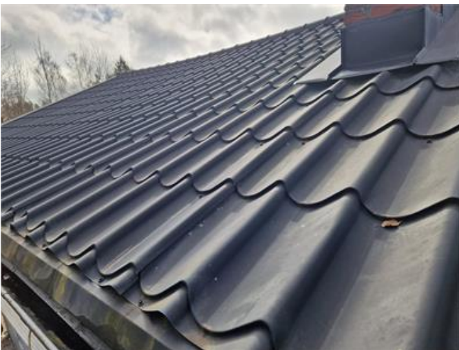
Vy på taket