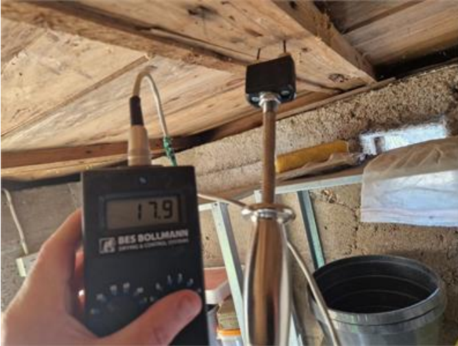
Stickprovsmässig fuktmätning i krypgrunden