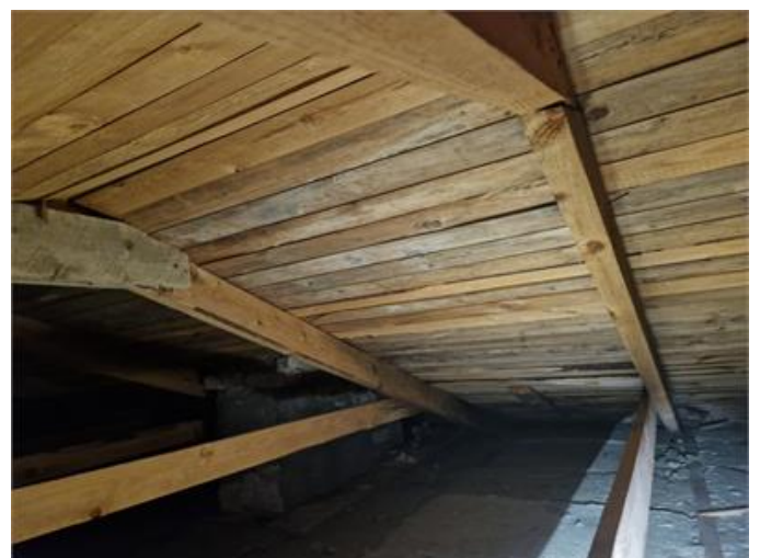
Vy på vindsutrymmet med fukt och mikrobiell påväxt på underlagstak