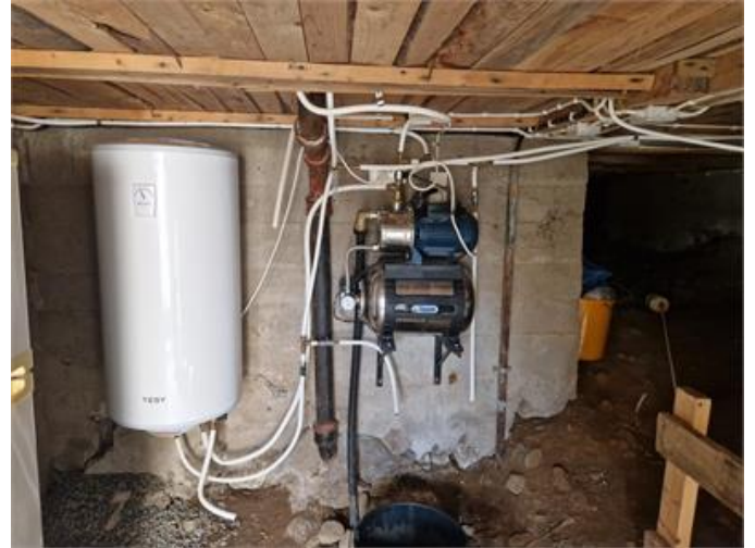
Vy i krypgrunden och med va installationer