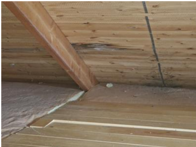
Lokal fuktfleck på underlagstak