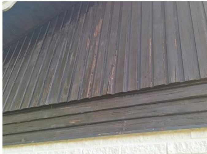
Viss fasadpanel är i behov av utbyte