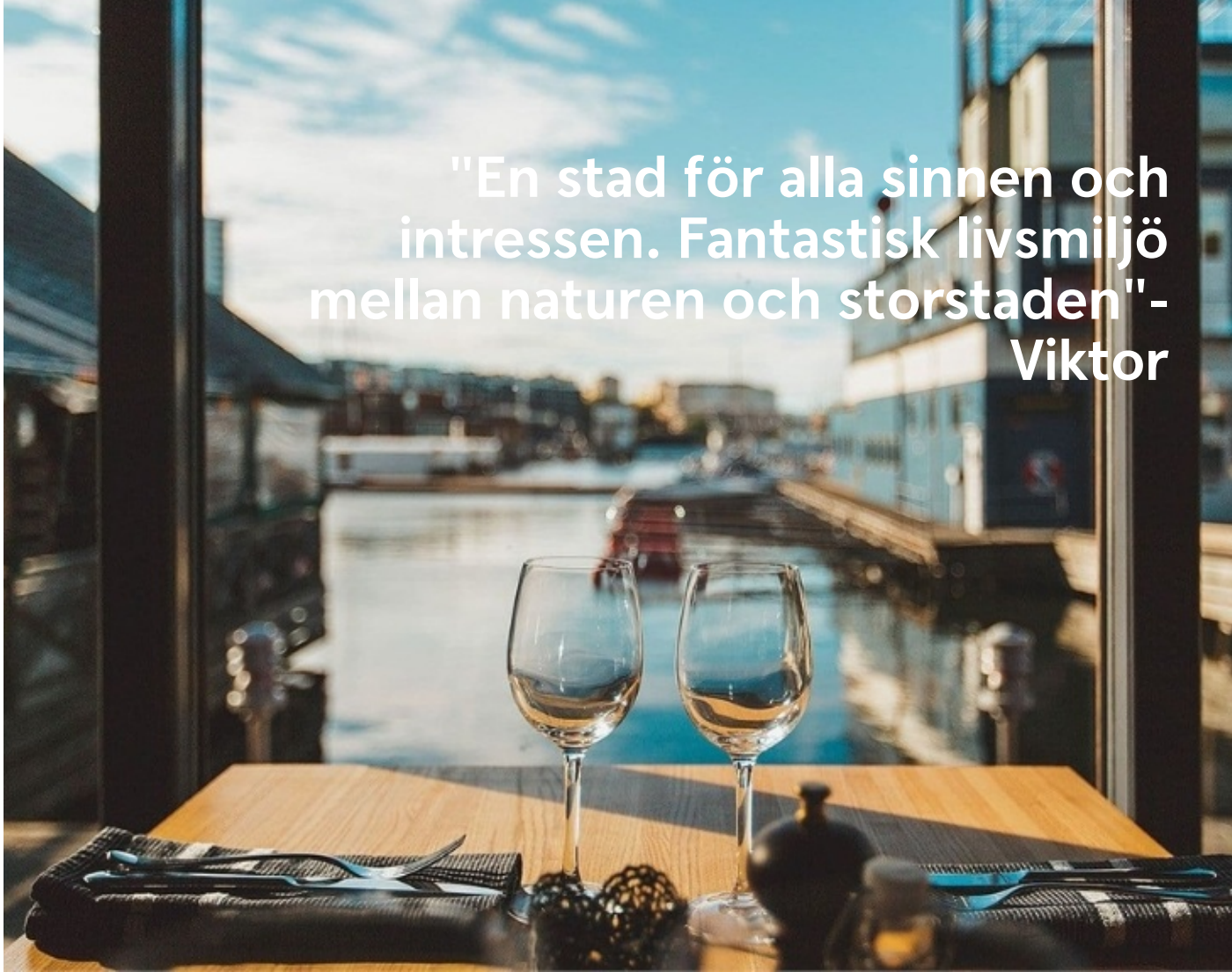
OVAN Pampas Marina.