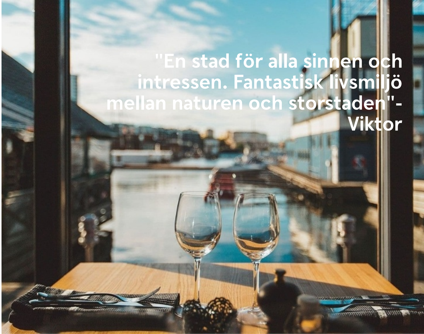
OVAN Pampas Marina.