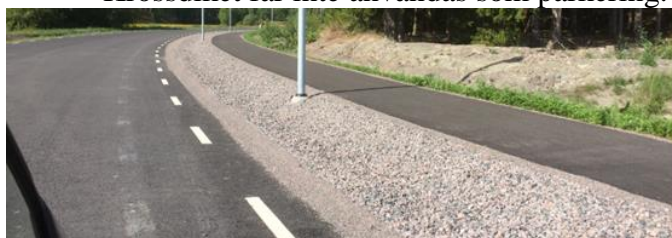
Figur 1. Exempel på krossdike. Holmtorpsvägen, Björkalund