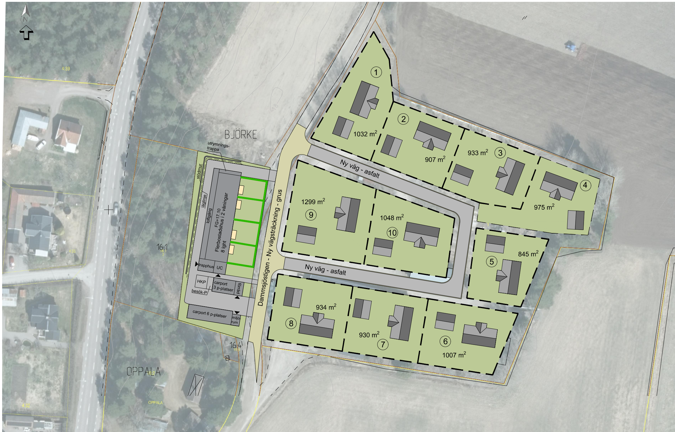
SITUATIONSPLAN SKALA 1:500 A1 / 1:1000 A3