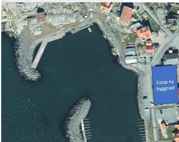
Placering av ny brygga.