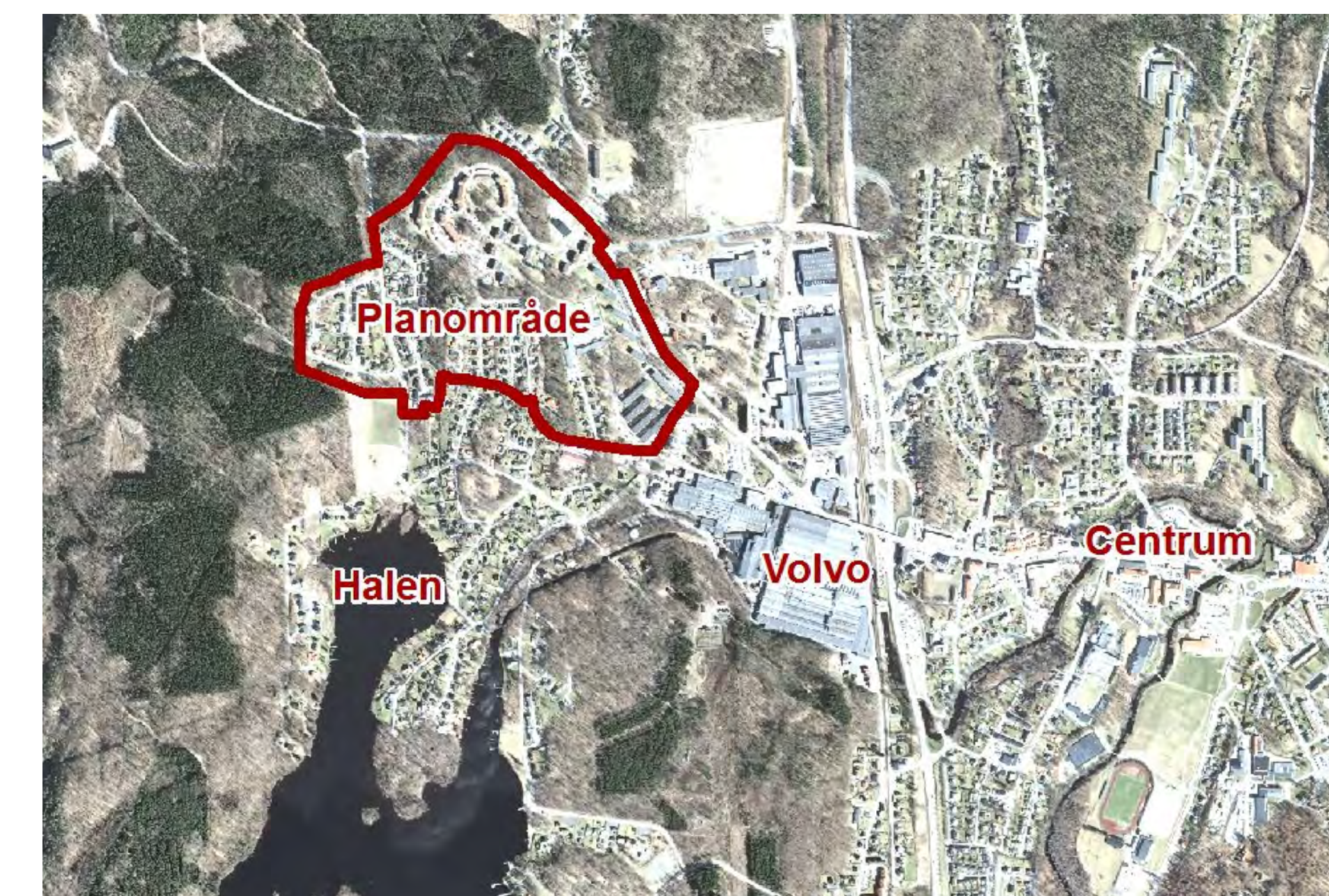
Planens läge i Olofström

Vid fällning av träd kan marklov krävas Genomförandetiden är 10 år från det planen vinner laga kraft