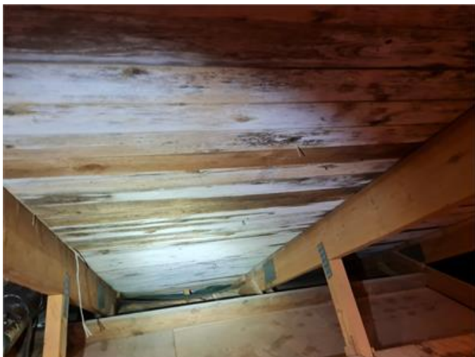
Bild visar mikrobiell påväxt mot underlagstaket på vindsutrymmet.