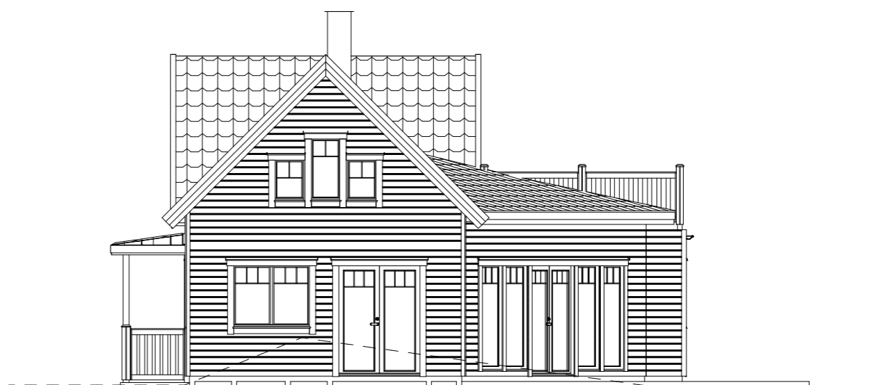
FASAD MOT ÖSTER FG +15.8