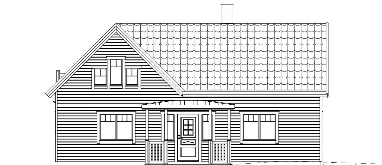
FASAD MOT SÖDER FG +15.8