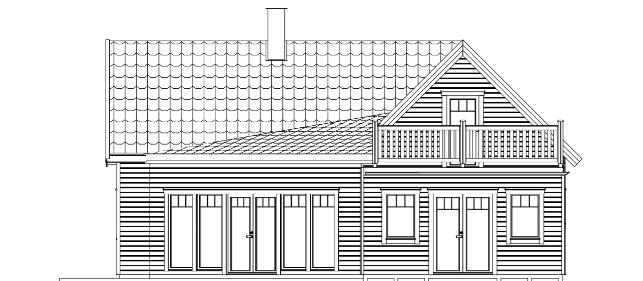
FASAD MOT NORR FG +15.8