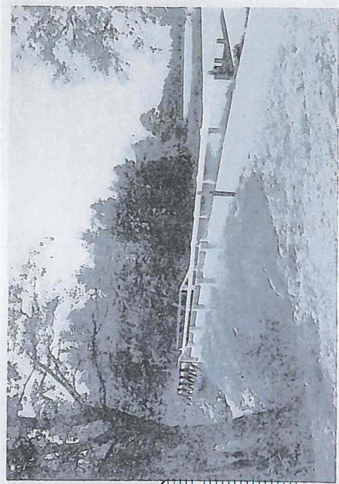
Broförbindelse fastlandet — Hasselö.