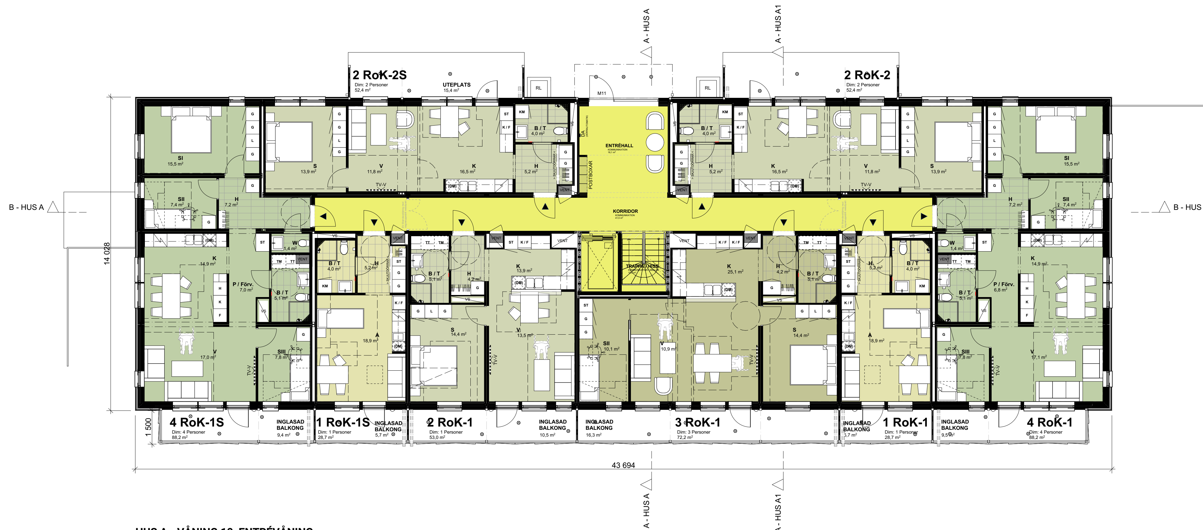
HUS A - VÅNING 10, ENTRÉVÅNING 1:100