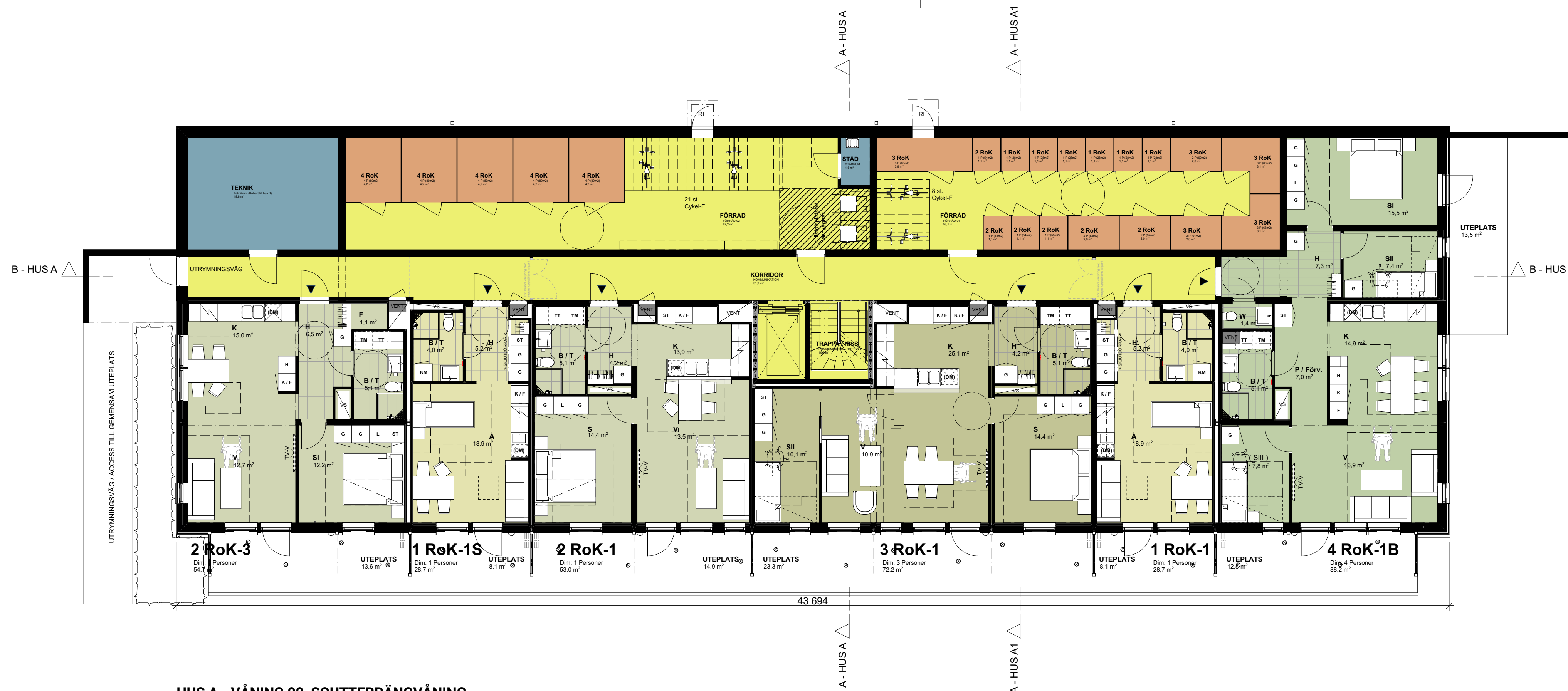
HUS A - VÅNING 09, SOUTERRÄNGVÅNING 1:100