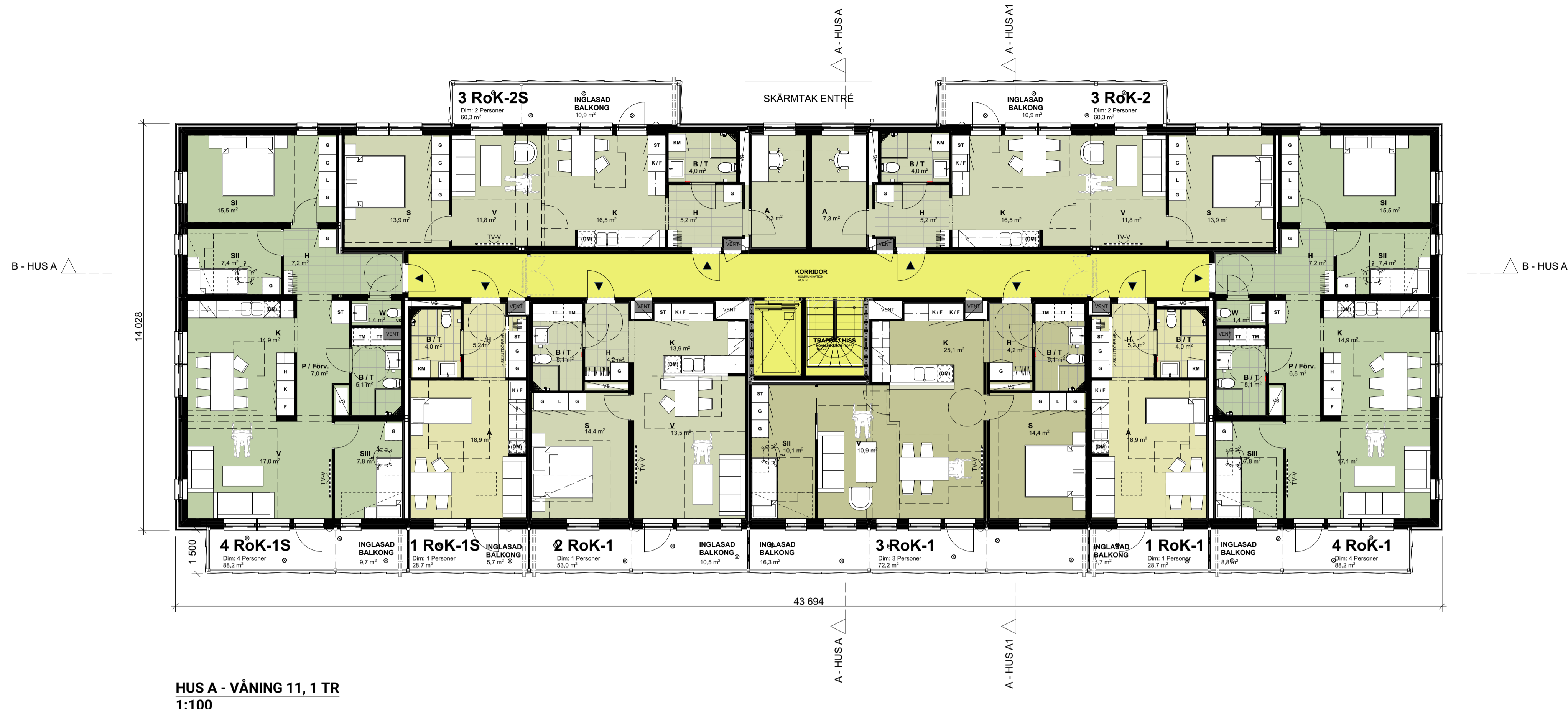
HUS A - VÅNING 11, 1 TR 1:100