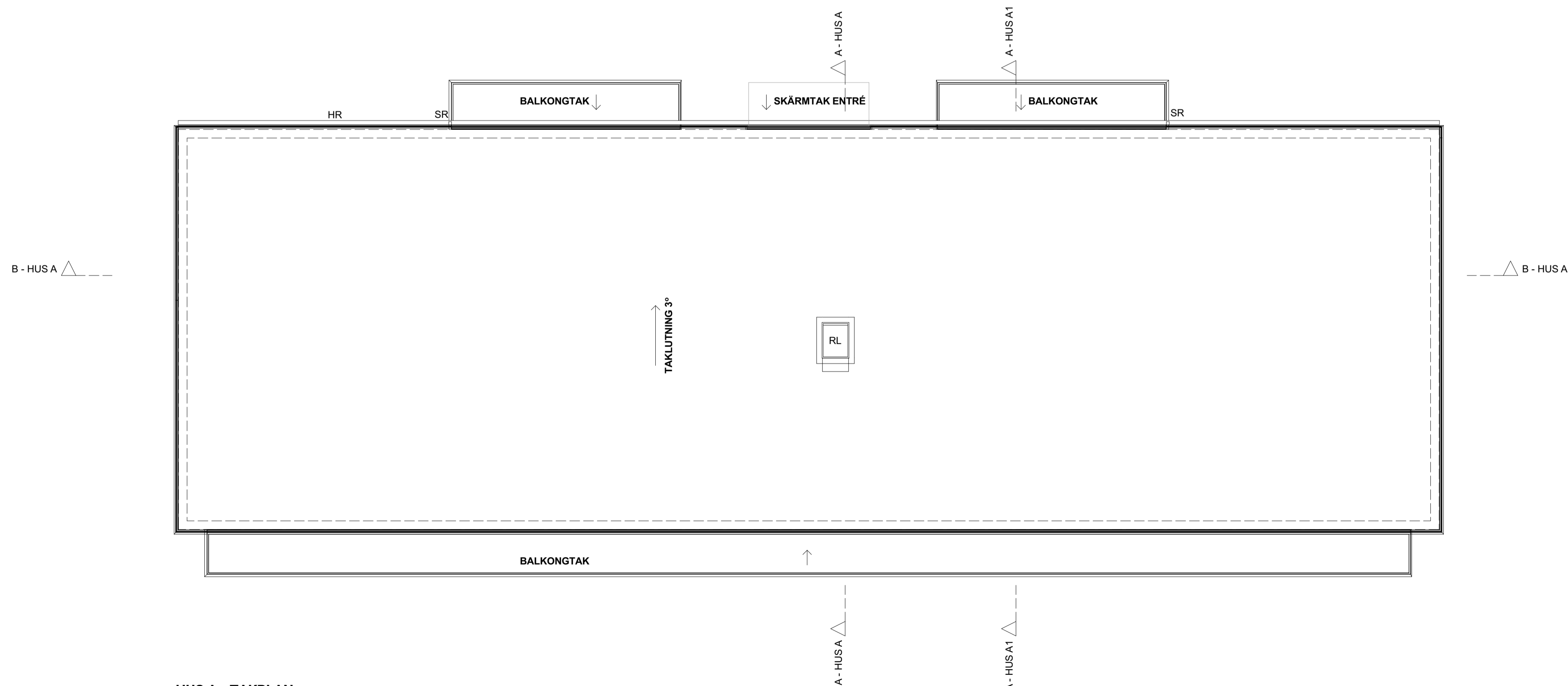
HUS A - TAKPLAN 1:100