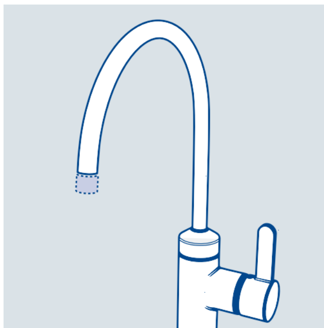
Ett sätt att minska vattenförbrukningen är att byta ut det gamla munstycket till ett vattenbesparande munstycke.