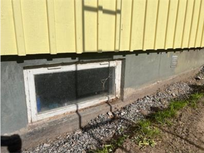
Pos 1. Rötskador förekommer i källarfönster.