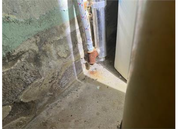
Pos 2. Kopplingar på vattenledning är rostiga.