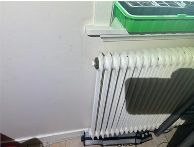
Pos 3. Fukt- och rinningsmärken förekommer på vägg under fönster.