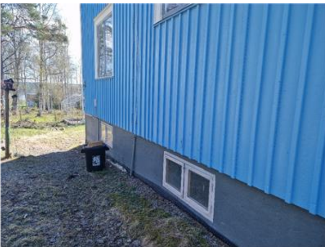
Fasad och sockel