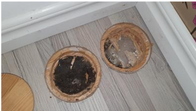
Bild på två provhål i golv i sovrum. Flytande golv med asfboard.